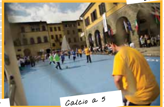
Calcio a 5